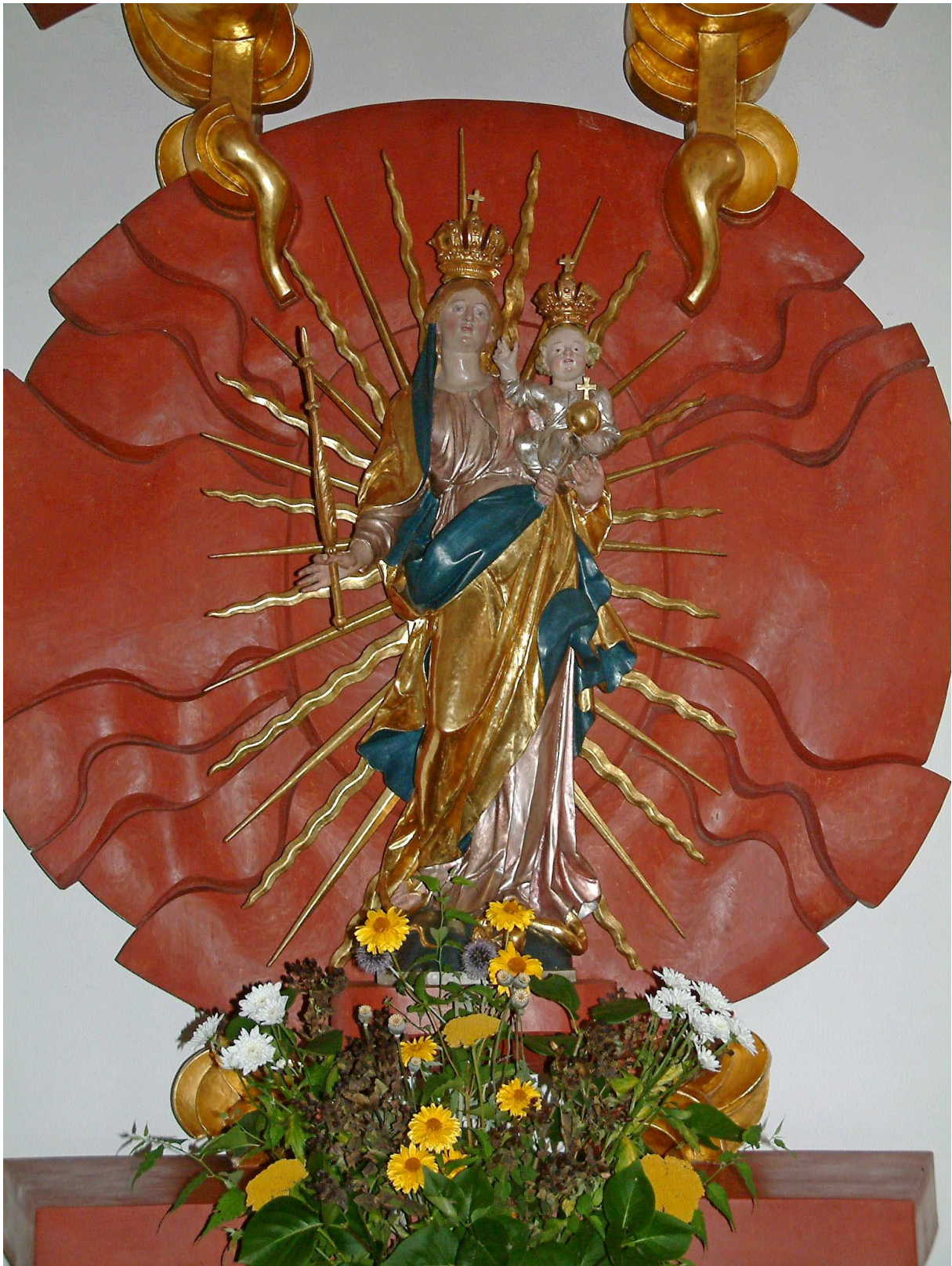
Marienstatue von Johann Oeter Wagner (1798) Wallfahrtskirche Fährbrück